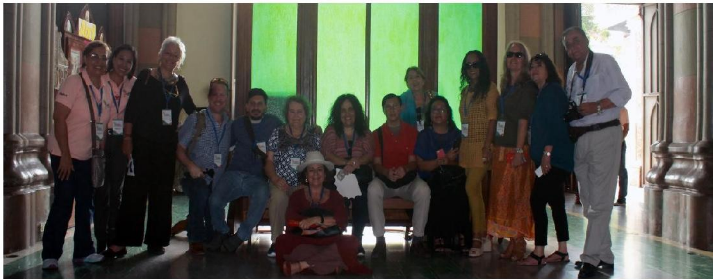
El equipo organizador junto a todos los artistas invitados al Festival Internacional de Arte y Literatura visitaron la catedral de Santa Ana durante el recorrido en el centro histórico de la ciudad.

En la tarde del día 2, se realizó junto con todos los artistas un recorrido por el centro histórico de la Ciudad, visitando el Teatro Nacional de Santa Ana, Iglesia Catedral y Mercado de Artesanías donde se conoció más sobre la ciudad morena, lugar sede del Festival Internacional de Arte y Literatura que alberga a los artistas invitados.