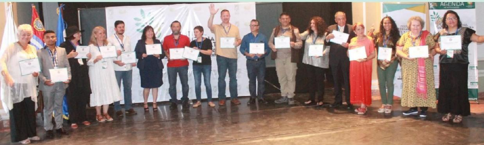
Parte de los artistas invitados al Festival de Arte y Literatura homenajeados como “Visitantes distinguidos de la ciudad” por la Alcaldía Municipal de Santa Ana.